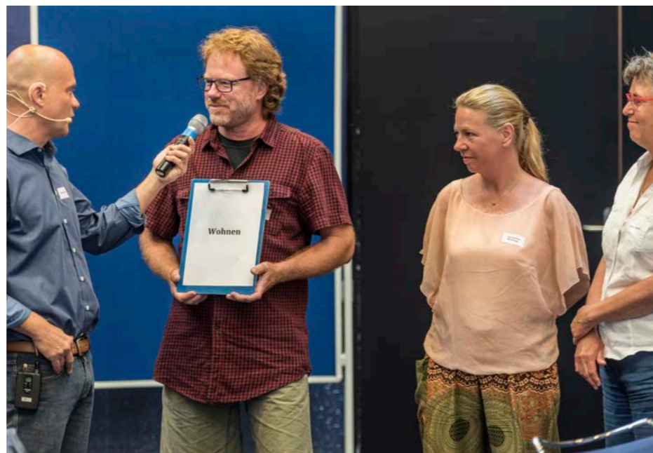
Vernetzungstag 2017 der Generationenakademie: Auch die Initianten von Zusammenleben Im Dorf sind dabei.

> Pizza-Abend der Bewohner(innen) im Openair Pavillon Im Dorf , Schenkön